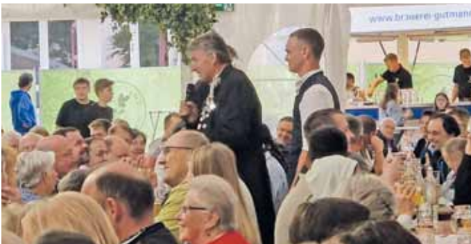
An allen drei Tagen herrschte gute Stimmung im Festzelt, hier zum Abschluss mit den Gstanzi von „Erdäpfelkraut“.