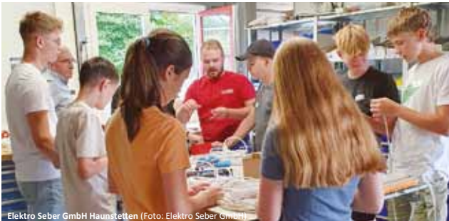
Elektro Seber GmbH Haunstetten

Unser herzlicher Dank gilt den Unternehmen, die mit viel Herzblut und tollen Aktivitäten den Teilnehmenden ihre Tätigkeiten näher gebracht haben und sich obendrein auch noch um die Verpflegung gekümmert haben!