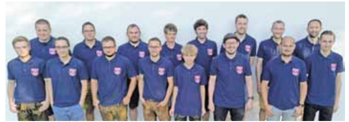
Anwesende Mitglieder des Feuerwehrvereins

darüber hinaus auch über das ehrenamtliche Engagement bei der Freiwilligen Feuerwehr informiert. Die durchweg positiven Rückmeldungen und Gespräche zeigen die Bedeutung der Feuerwehr Badanhausen und deren Ergänzung durch den Feuerwehrverein. (Text: Stefan Karl)