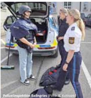
Polizeiinspektion Beilngries