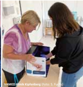
VAMED Klinik Kipfenberg