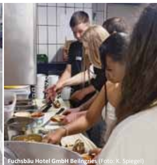
Fuchsbau Hotel GmbH Beilngries