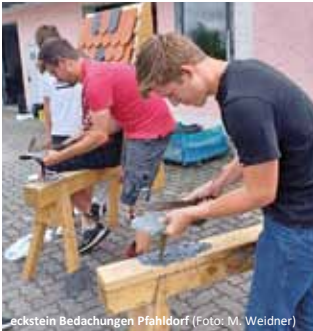
eckstein Bedachungen Pfahlörf